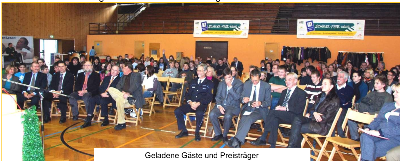
Geladene Gäste und Preisträger