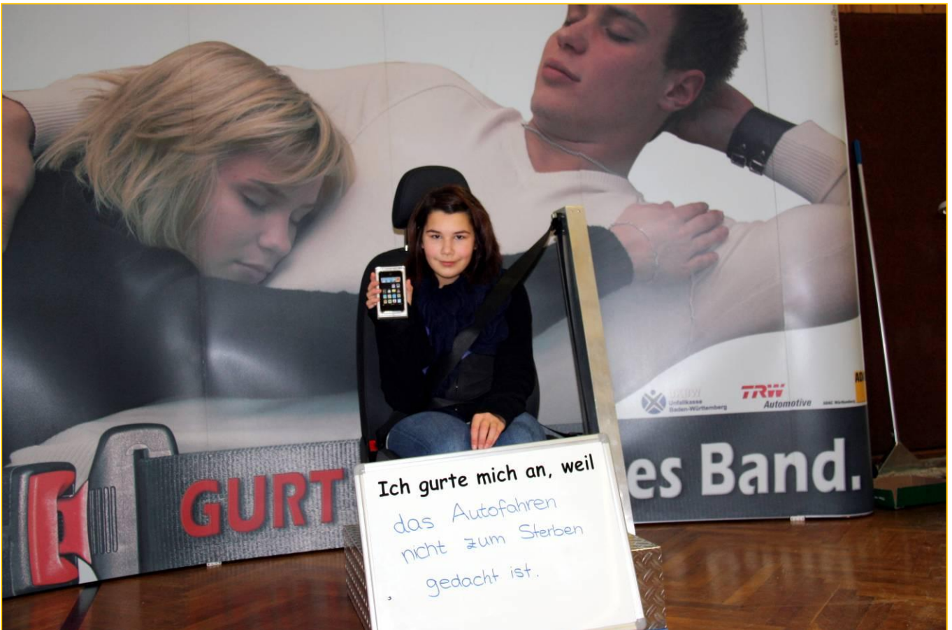
Gewinnerin eines iPod